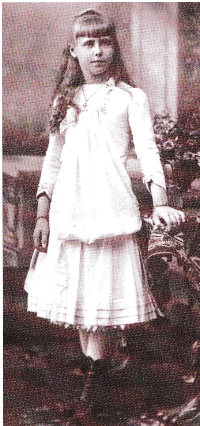
Missy poartă lăntișoare cu pandativ-cruce la vârste diferite ale copilăriei (fotografii de W. & D. Downey, p. 10 sus, și Eduard Uhlenhuth, p. 11).

Cadourile din perioada victoriană erau diverse, de la păpuși, case pentru păpuși, lanterne magice, cărți, servicii de ceai în miniatură, însă bijuteriile, precum lanțuri, broșe, brățări, completau ținutele micii prințese, pregătind-o pentru diverse întâlniri de familie, călătorii sau ceremonii.